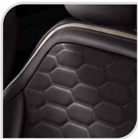
Tapicerka skórzana Lux w tonacji Charcoal Black bez dopłaty