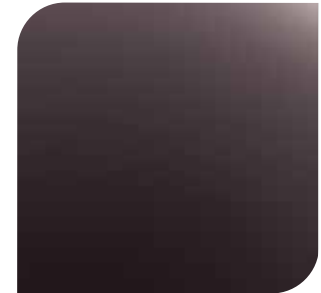
Ametista Scura 1 600,- lakier metalizowany specjalny