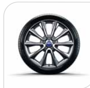
Kóło dojazdowe - mini z 17" obręczą stalową standard