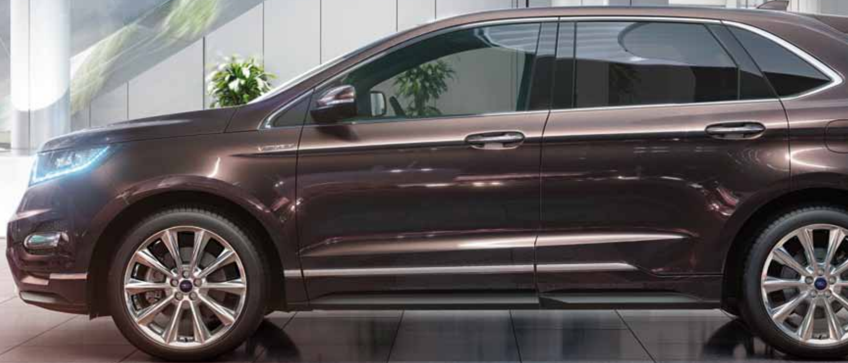
Ford Edge Vignale z 20" obręczami kół ze stopów lekkich bez dopłaty