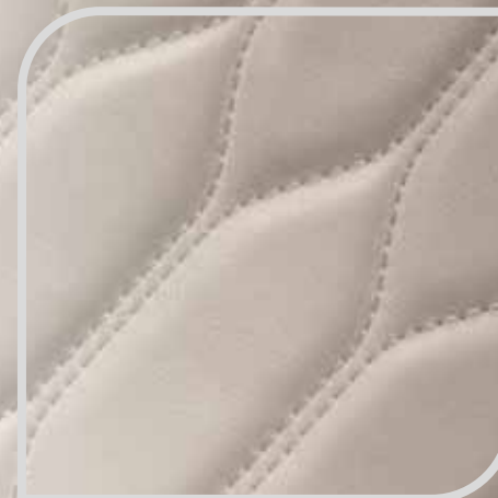
Tapicerka skórzana Lux w tonacji Cashmere bez dopłaty