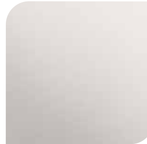
White Platinum 1 600,- lakier metalizowany specjalny