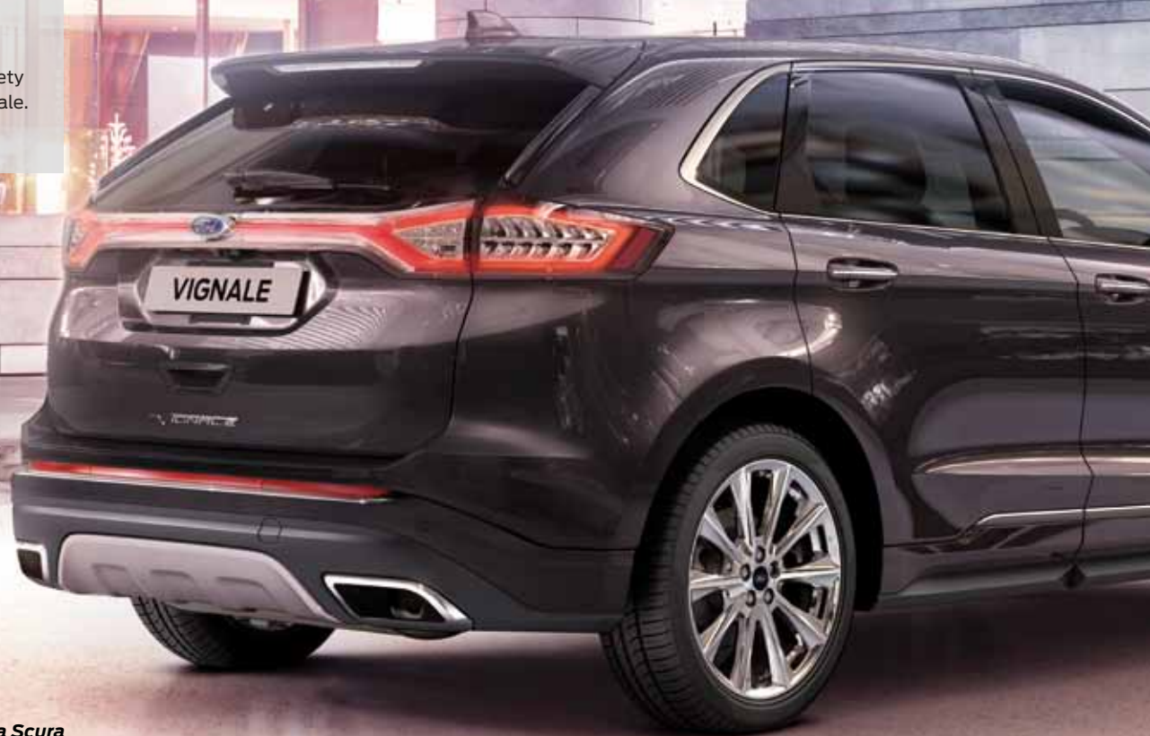
Ford Edge Vignale w kolorze Ametista Scura opcja

Ekskluzywny wygląd podkreśla unikalny kolor Ametista Scura - z palety zarezerwowanej tylko dla wersji Vignale.