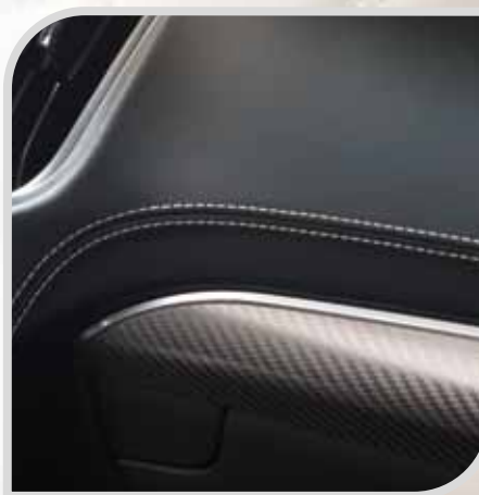
Obszyta skórą deska rozdzielcza standard