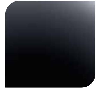
Mica Shadow Black bez dopłaty lakier specjalny