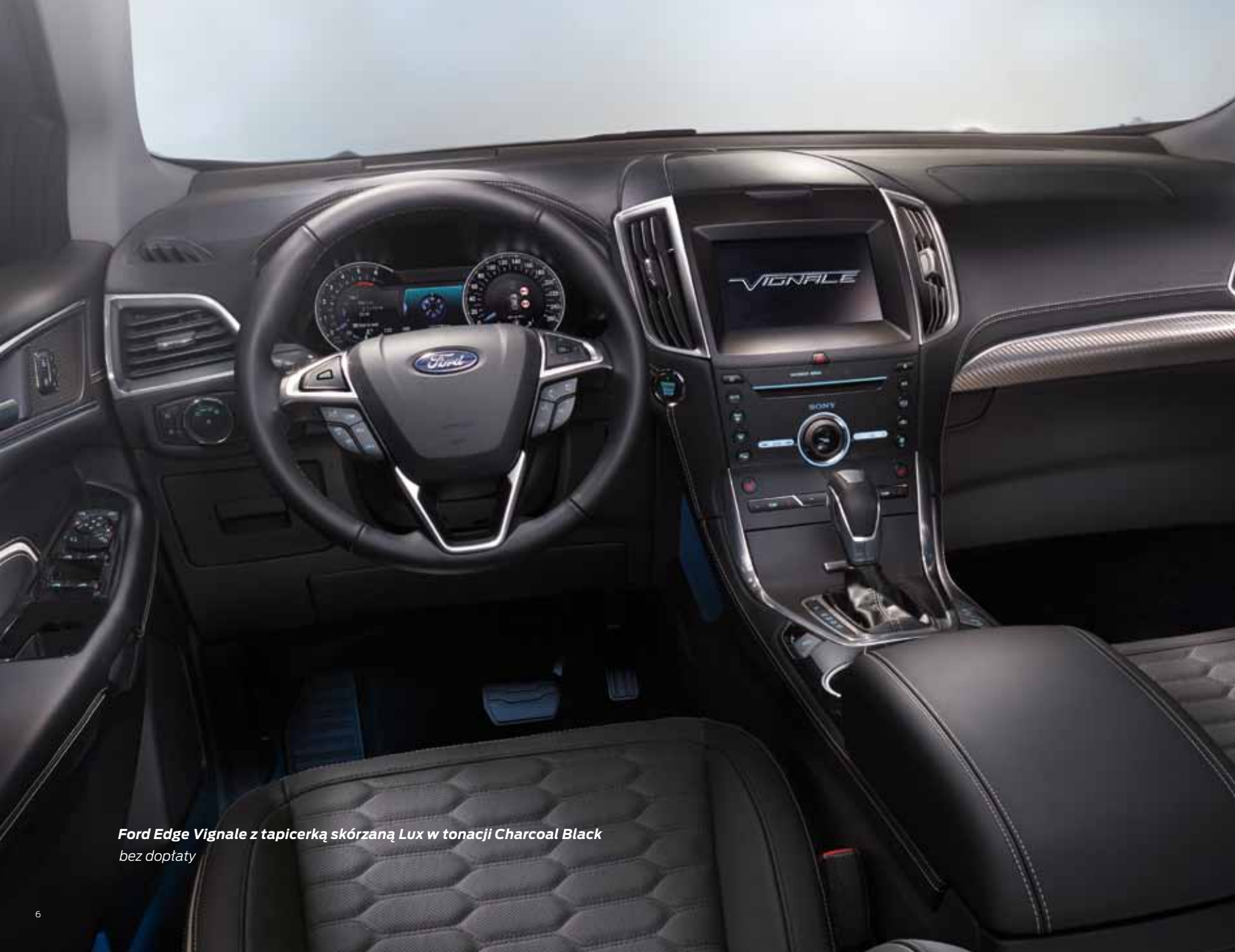
Ford Edge Vignale z tapicerką skórzaną Lux w tonacji Charcoal Black bez dopłaty