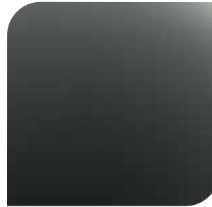
Magnetic Grey bez dopłaty lakier metalizowany